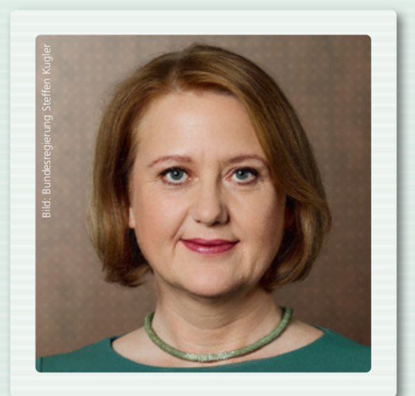
Lisa Paus, Bundesministerin für Familie, Senioren, Frauen und Jugend

Alle Sammelstellen finden Sie unter www.Kinderzukunft.de